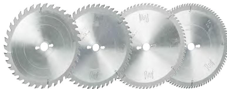
B 5404 Dent. grossa B 5405 Dent. media B 5406 Dent. fine B 5407 Dent. finissima

Con tagli di silenzatura per Ø 250÷350 Con affilatura alternata Per tagliare pannelli agglomerati con rivestimenti per materiali plastici in genere, formica, bachelite, plexiglas, cartoni duri