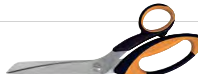
Per fibra di vetro e carbonio