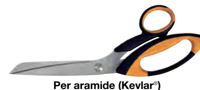
Per aramide (Kevlar®)